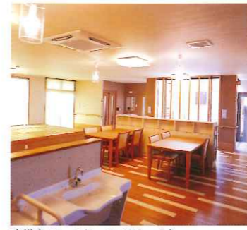
食堂(コミュニケーションルーム)

昔懐かしい趣と現代感覚が融和した「和・モダン」空間。 そこには、ゆったりとした時間が流れ、ゆとりの共用スペースは、集う人をあたたかく迎えてくれます。 当施設はつねに親しみに溢れたふれあいの場と心地よさを満喫できる 「安心のケア」を第一に考えています。