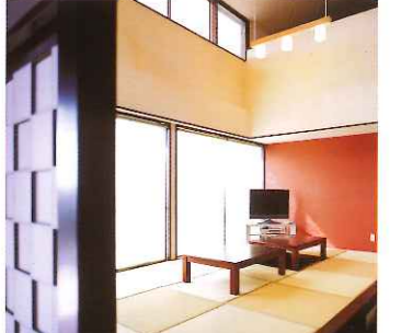
吹抜けのある畳コーナー