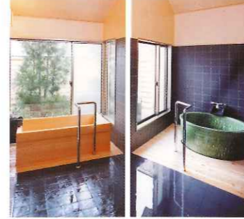
心身ともにリフレッシュできる浴室