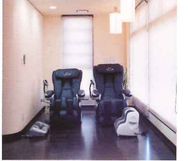
リラクゼーションスペース