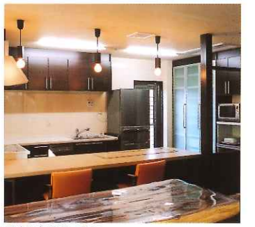
設備充実のキッチン