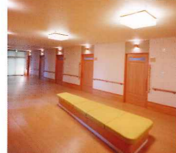
広々とした廊下に面した居室