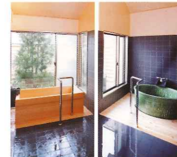
心身ともにリフレッシュできる浴室