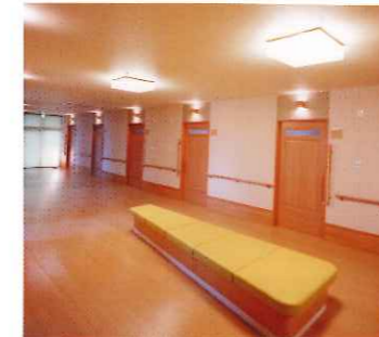
広々とした廊下に面した居室