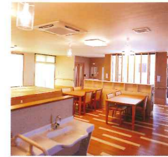
食堂(コミュニケーションルーム)