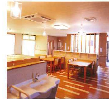
食堂(コミュニケーションルーム)