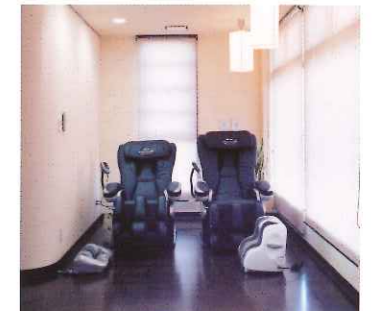
リラクゼーションスペース

全室個室のプライベートルーム 住む人の視点から設備された「安心」と「快適空間」。