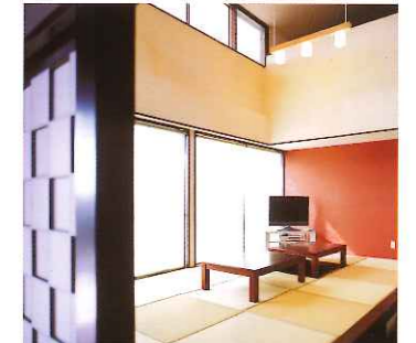
吹抜けのある畳コーナー