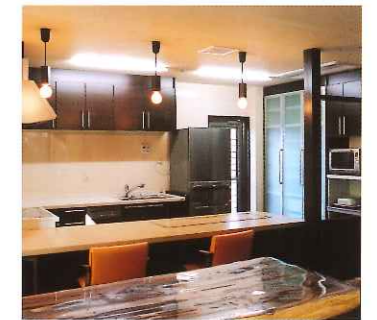
設備充実のキッチン