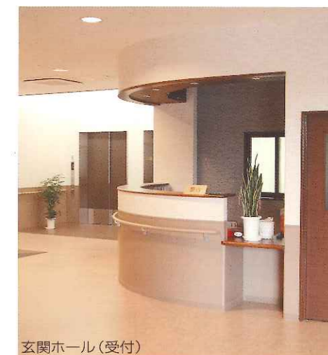
玄関ホール(受付) 落ち着いた色調でコーディネート。

個人情報の保護について 個人情報に関する法令、その他関係法令及び厚生労働省のガイドラインを遵守し、個人情報の保護を図ります。