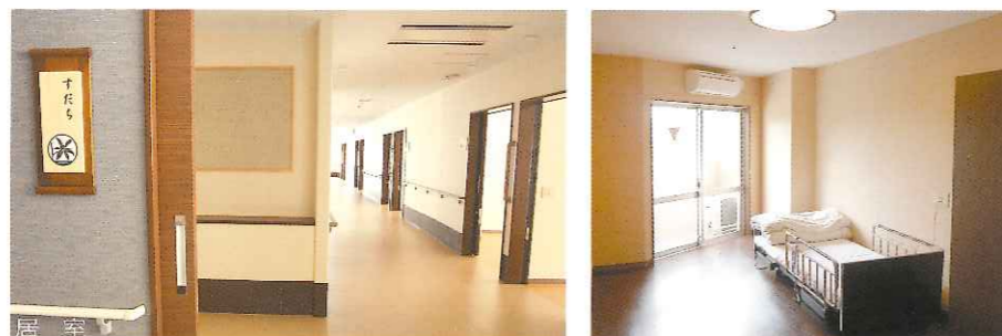
居室 2階から4階まで、全個室120室。明るく清潔感のある室内ではプライベートな時間をゆっくりと過ごしていただけます。