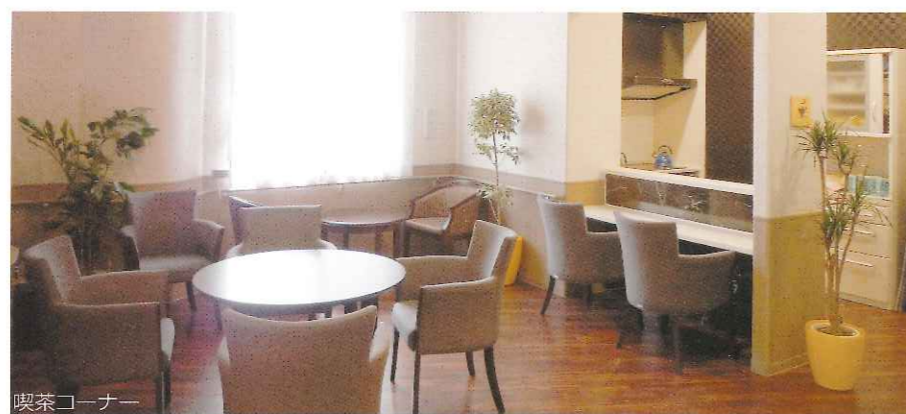
喫茶コーナー 音楽を聞いたり、お茶を飲んだり……ご利用者の方が集う憩いのスペース