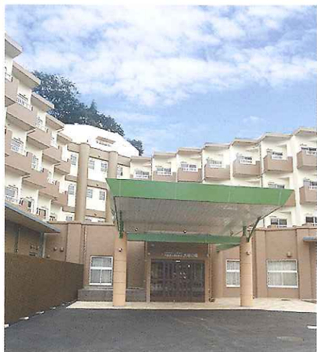
ユニット型介護老人福祉施設（特別養護老人ホーム）

当施設は、ユニットケアに取り組んでおります。高齢者の方々が安心して毎日をお過ごしいただくために、理想の環境づくりに努めています。家庭的な雰囲気の中で、入居者の自立をサポートし、生きがいづくりのお手伝いをさせていただきます。