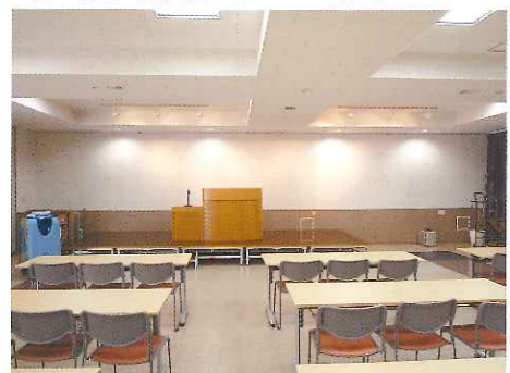
地域の方々、ボランティア、研修生との交流の場。