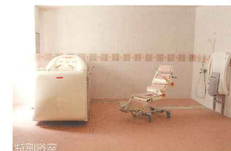
特別浴室 ひとり一人ゆったりと入浴できる浴槽を完備した浴室です。